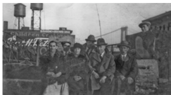
“Españoles en las Américas”

Para muchos, esta frase evocará sin duda imágenes de los conquistadores y frailes que en nombre de la corona española conquistaron y colonizaron buena parte de los continentes americanos en los siglos XVI, XVII y XVIII.