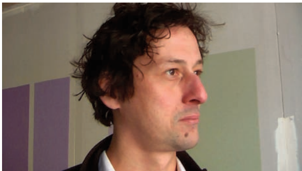
ARNAUD Vídeo Retrato # 4 París, Febrero 2011